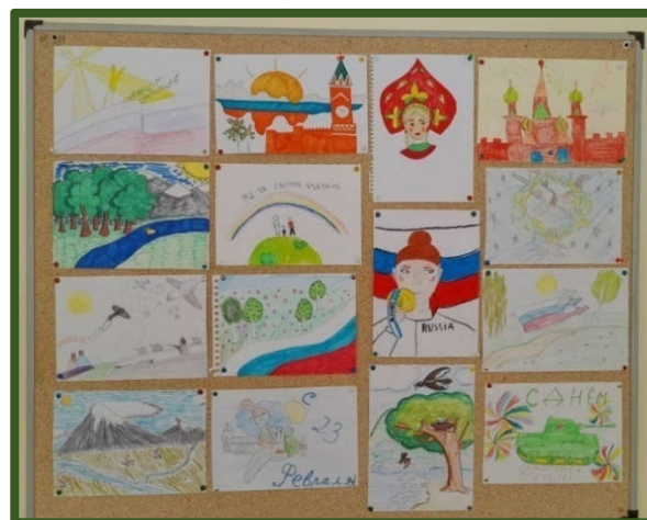
Плакаты и рисунки наших учеников, посвященные 23 февраля Дню защитника Отечества.