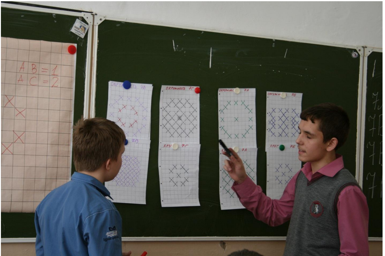
Спорим по существу вопроса